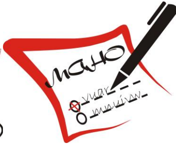
Brief om in te vullen